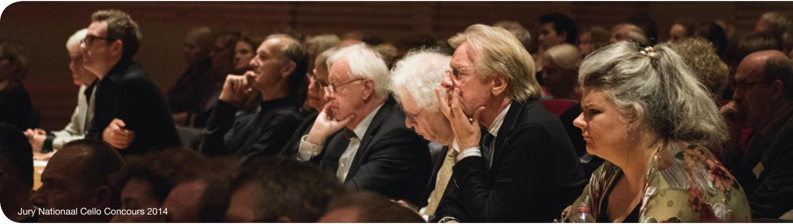
Jury Nationaal Cello Concours 2014