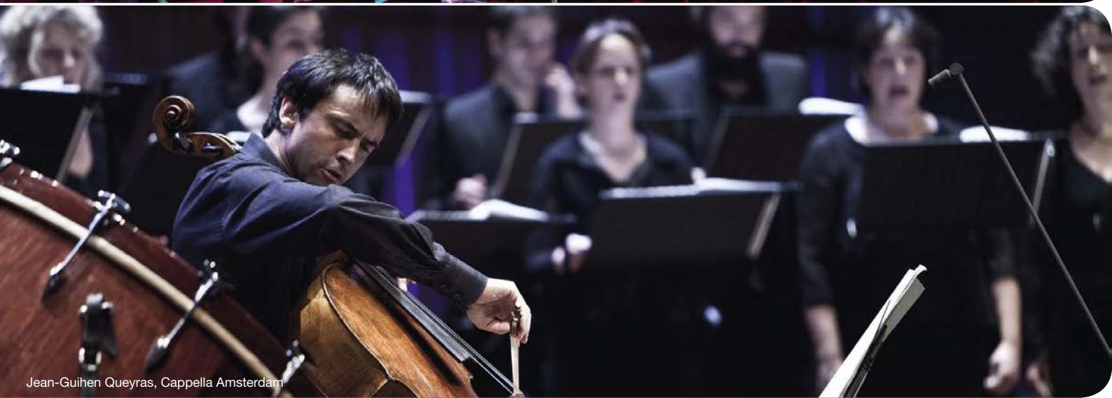
Jean-Guihen Queyras, Cappella Amsterdam