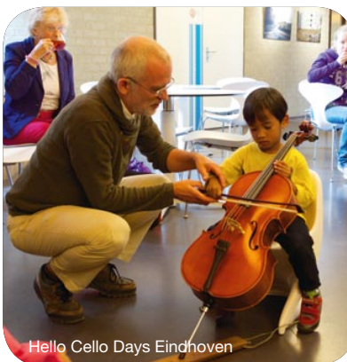
Hello Cello Days Eindhoven