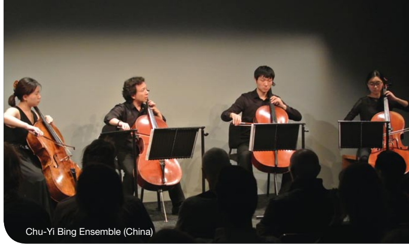
Chu-Yi Bing Ensemble (China)

The Klankspeeltuin (Sound Garden) in the Muziekgebouw aan 't IJ (7+ and adults) featured, not surprisingly, the cello. The sound installations produced cello sounds, while a cellist composed a piece with the visitors, cello video clips were on display and visitors could try their hand at the cello.