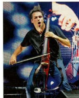
Internationale sensatie 2CELLOS

Je kunt bijna niet anders dan houden van de cello. Het instrument is mooi getailleerd, wulps bijna en warm. En de toon komt uit diepten die doen vermoeden dat zich in het houten lijf een universum verschuilt. De virtueuze viool drong de cello lange tijd in een dienende rol. Ze mocht het muzikale fundament leggen waarop solo-instrumenten weelderige paleizen optuigden. Maar nadat Johann Sebastian Bach – weer hij – in zijn zes solosuites de mogelijkheden van de cello verkende, ontwikkelde het instrument de afgelopen eeuwen een eigen stem. En die stem wordt geëerd tijdens de Cello Biënnale. Alle facetten