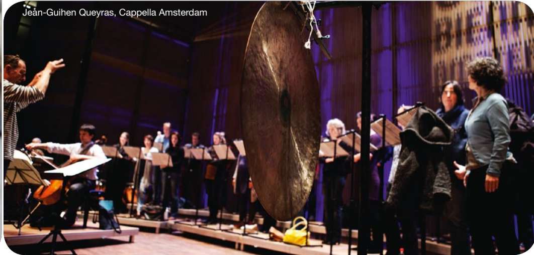
Jean-Guihen Queyras, Cappella Amsterdam