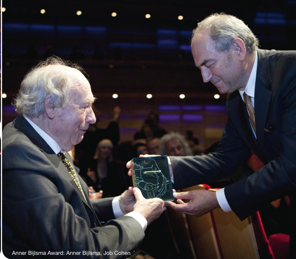
Anner Bijlsma Award: Anner Bijlsma, Job Cohen