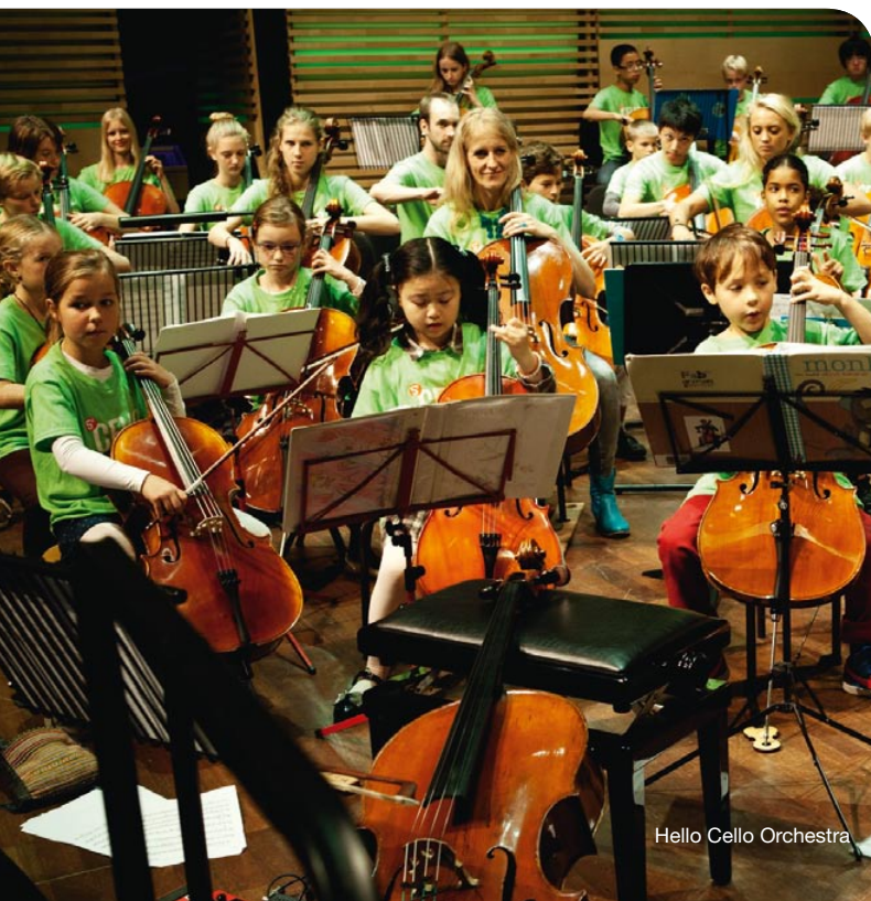
Hello Cello Orchestra

There was a completely different school project at the Amsterdam Valentijnschool. Four American cello students from the renowned New England Conservatory, who were visiting the