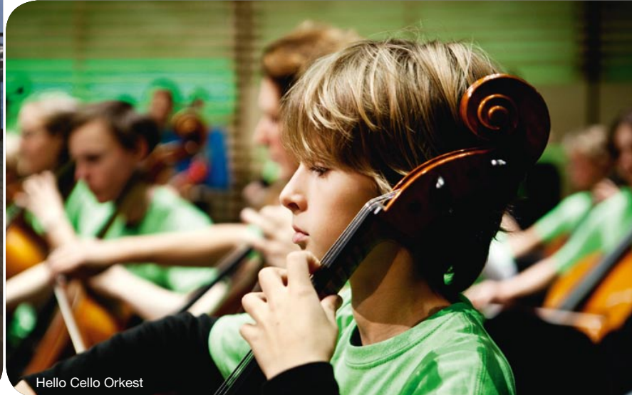
Hello Cello Orkest